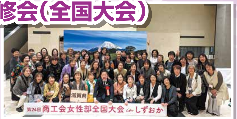
全国大会にみんなで参加しました