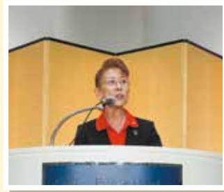
全女性連竹中会長の基調講演