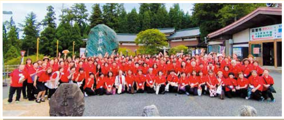
最後にみんなで記念撮影!