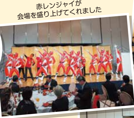
赤レンジャイが 会場を盛り上げてくれました