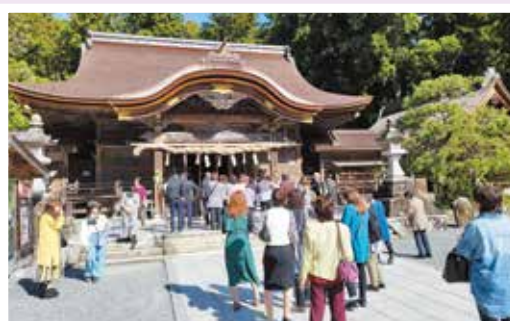
縁結びの神様小國神社を参拝