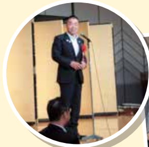
懇親会には 三日月知事もご臨席