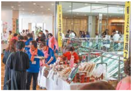
物産展会場は大盛況