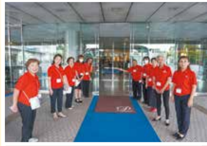
滋賀県女性部員138名が笑顔でお出迎え

2日間の研修会を経て、参加部員の資質向上だけでなく、他府県の女性部との交流を深めるとともに、滋賀県女性部の結束をより強固なものとする素晴らしい機会とすることができました。