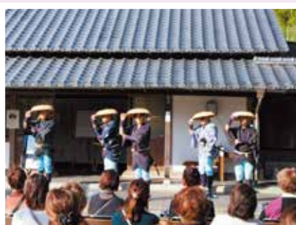
大旅籠柏屋では旅武士の舞踏を見学