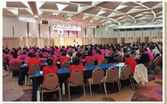
約450名が参加の会場は、壮観!