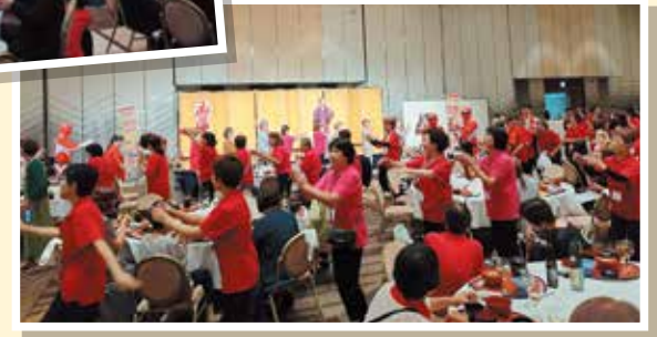
みんなで江州音頭!