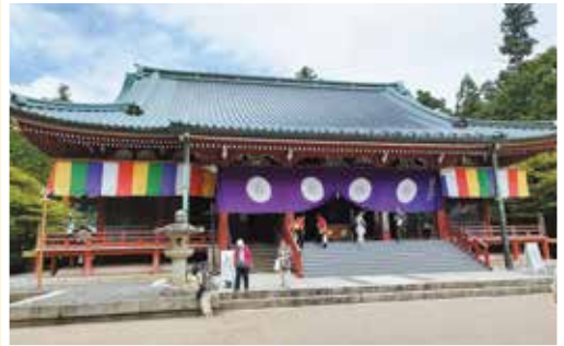
比叡山大講堂を参拝