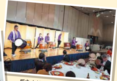
兵主太鼓の迫力ある太鼓演奏