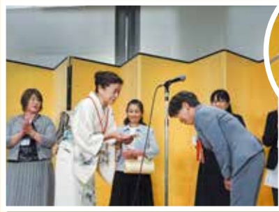
優良賞、頑張りました!