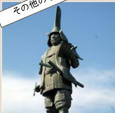
2025年1月 女性のつどい講演会 近江日野の歴史について学ぶ