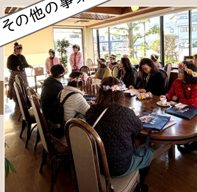
2024年11月 おもてなし交流事業 岐阜県山県市商工会女性部