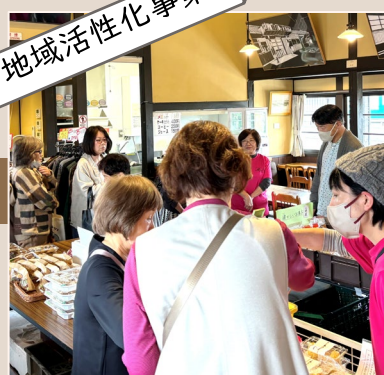
2024年11月 お弁当の食数を増やし 売上UP