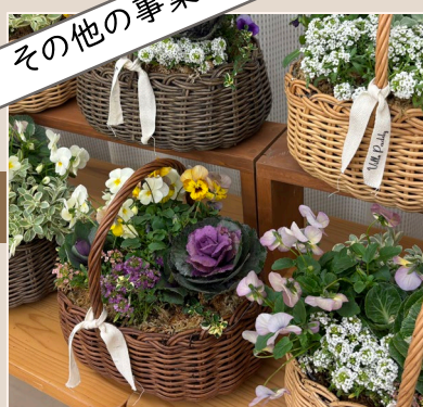
2024年12月 プリコラージュを通して 個性を引き出す