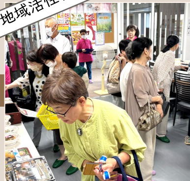
2024年9月 出張おかみさんマルシェ 敬老会同時開催