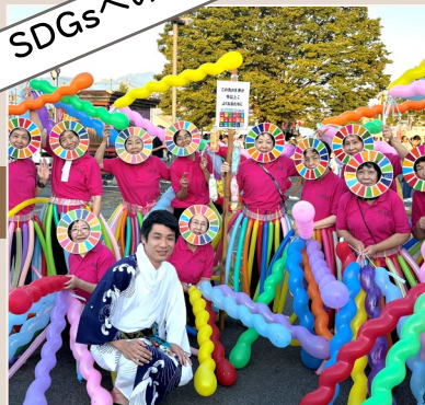
2024年8月 氏郷まつり夏の陣で SDGs啓発活動