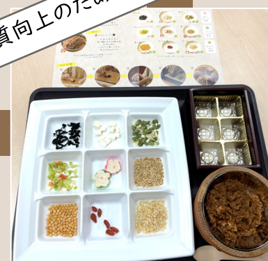
2024年11月 県外研修「みそ楽」にて みそ玉作り