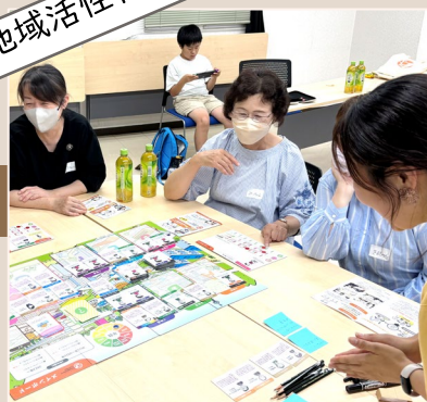
2024年7月 超高齢社会に対応する ための研修を実施