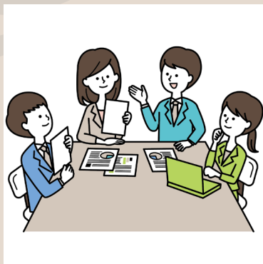
2024年4月 事業計画作成